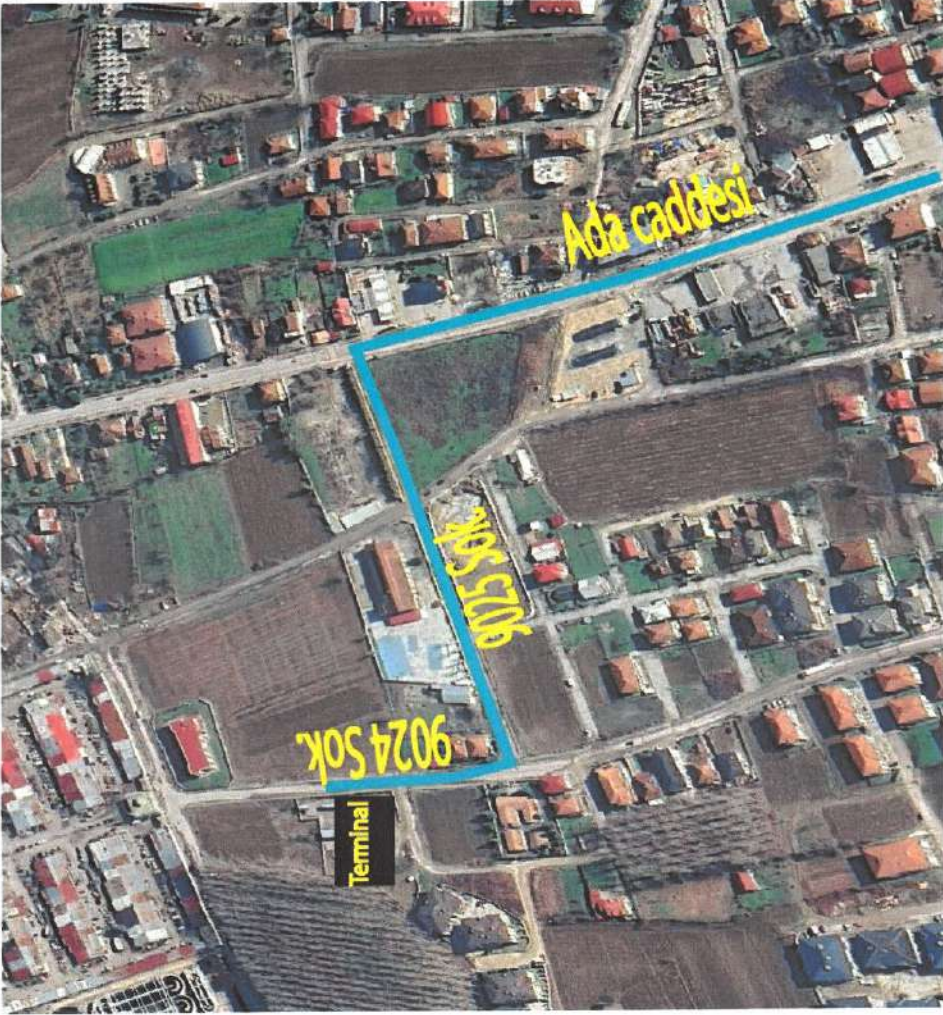
Akyazı Şehirçi Minib. Terminal güzergahı